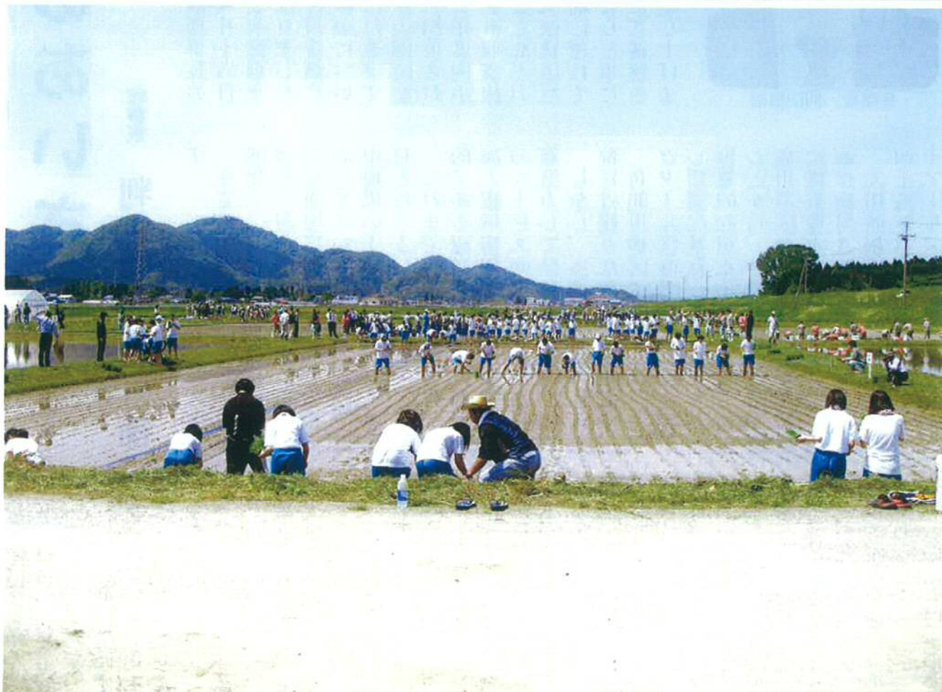
中・高生による田植え(大曲西根地内)

編集・発行 水土里ネット大曲 大仙市大曲土地改良区 大仙市大曲西根字小館10 電話 0187-68-3031 F A X 0187-68-3733