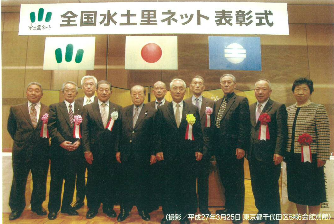
(撮影 / 平成27年3月25日 東京都千代田区砂防会館別館)