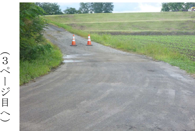
◇簡易舗装完成(左写真)