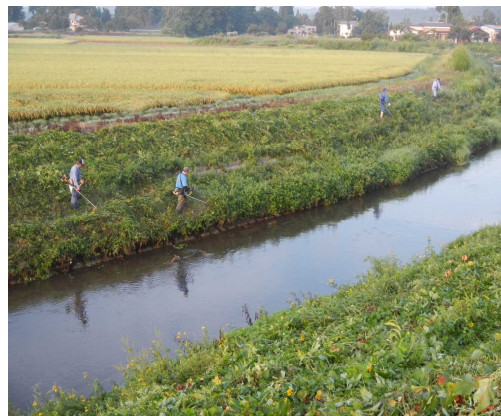
◇小友川の草刈り (左写真)