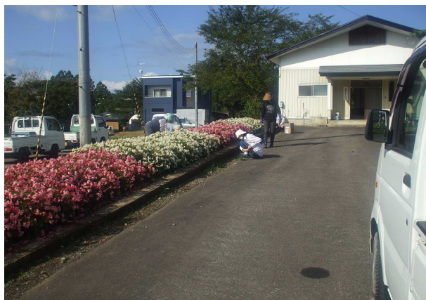
◇中沢会館花壇の除草 (左写真)