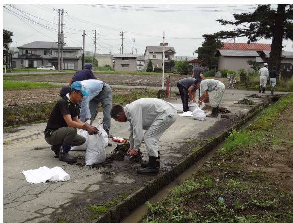
◇館荒町周辺の水路の泥 上げ (左写真)