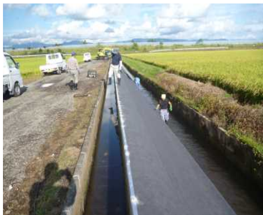
◇木内幹線排水路法面の 防草シート施工

●今年度は、農地維持活動 を中心に行いました。 新たな取り組みとして防 草シートと簡易舗装資材 の試験施工を行い今後の 活動に利用していきたい と考えています。