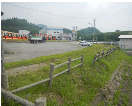
◇明通ため池の点検 (左写真)