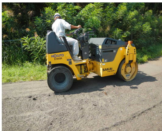
◇柳中島高速道路横断ボツ クス付近の簡易舗装施工 (左写真)