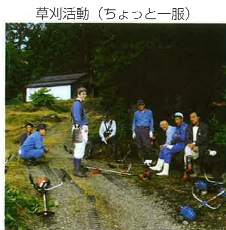
草刈活動（ちょっと一服）