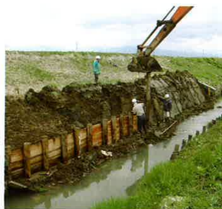
排水路の補修活動

これは農業生産の基盤となる農地、水、環境の保全と質的向上を図ることが必要であり、農業用水等の資源については、過疎化、高齢化、混住化等の進行に伴う集落機能の低下により、適切な保管理が困難となってきた現状にあることから、このため農業用排水路、ため池、農道その他多くの農村資源に対して、農業者だけでなくそこに住む地域住民みんなが多様な参画共同活動をすることで、地域全体の生活環境の保全、生態系保全、景観形成等を図ろうとするものです。