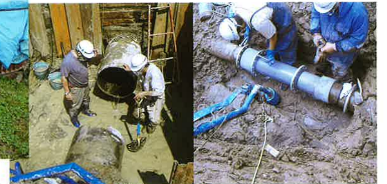
パイプラインの損傷と補修