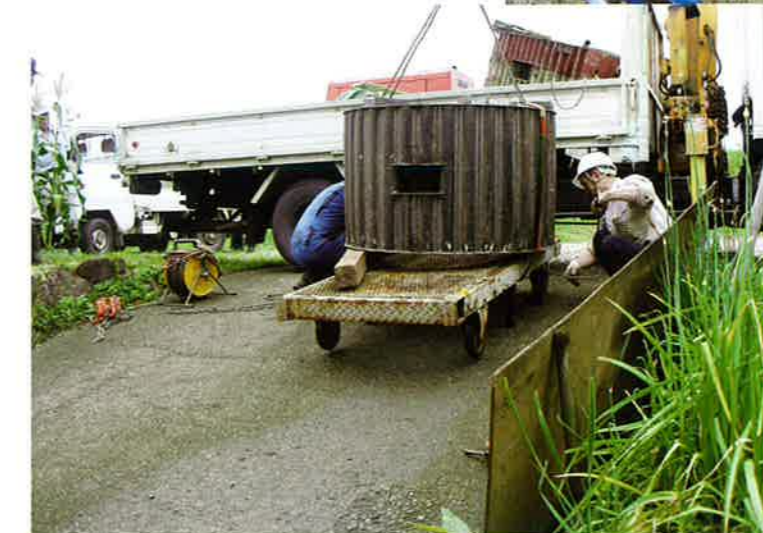
液体抵抗器の代替品設置