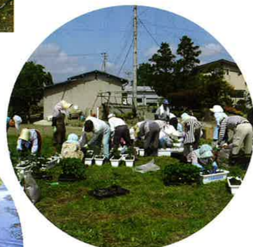
プランター植栽活動