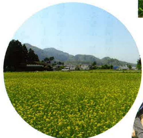
休耕田を活用した環境活動(菜の花)