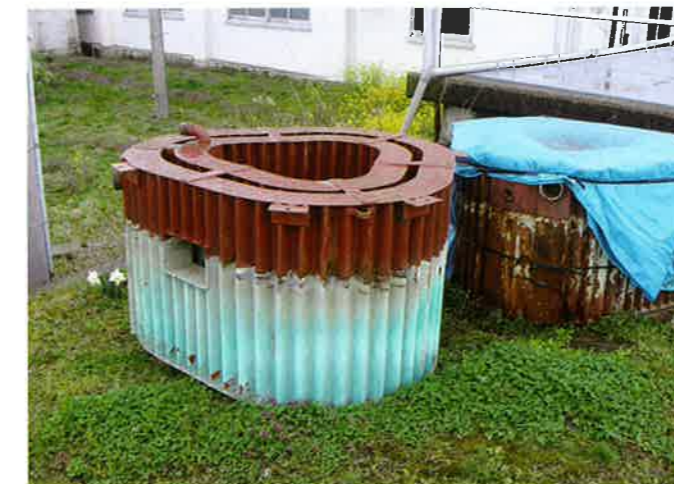
液体抵抗器の腐食状況

大川西根地区ではパイプラインによる灌漑方式となっておりますが、揚水機を含め施設は造成後35年を経過していることから老朽化が著しく、揚水機可動の設備一式に不具合が発生している状況にあります。このため施設の更新並びにパイプラインの老朽化も併せると全体的な管理計画と見直しが必要となり、現在その方向性について検討されています。