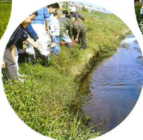
子供達による河川愛護